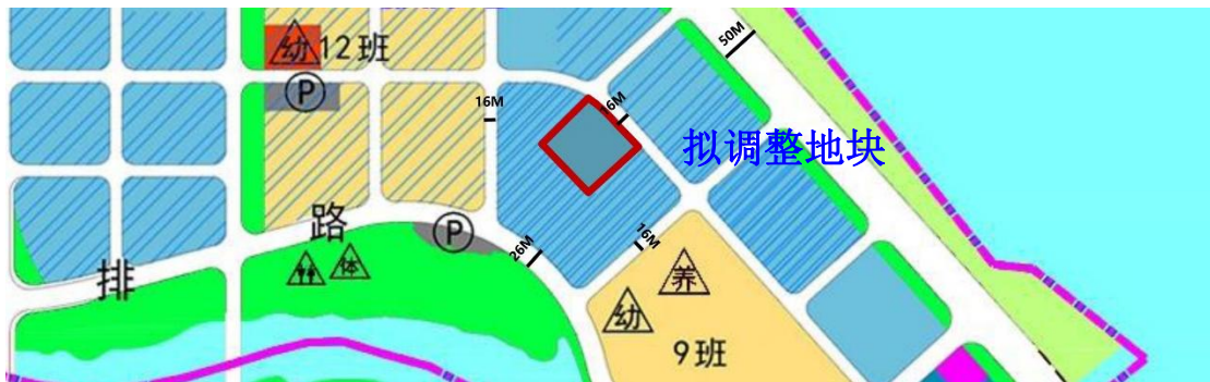
拟调整地块区位图