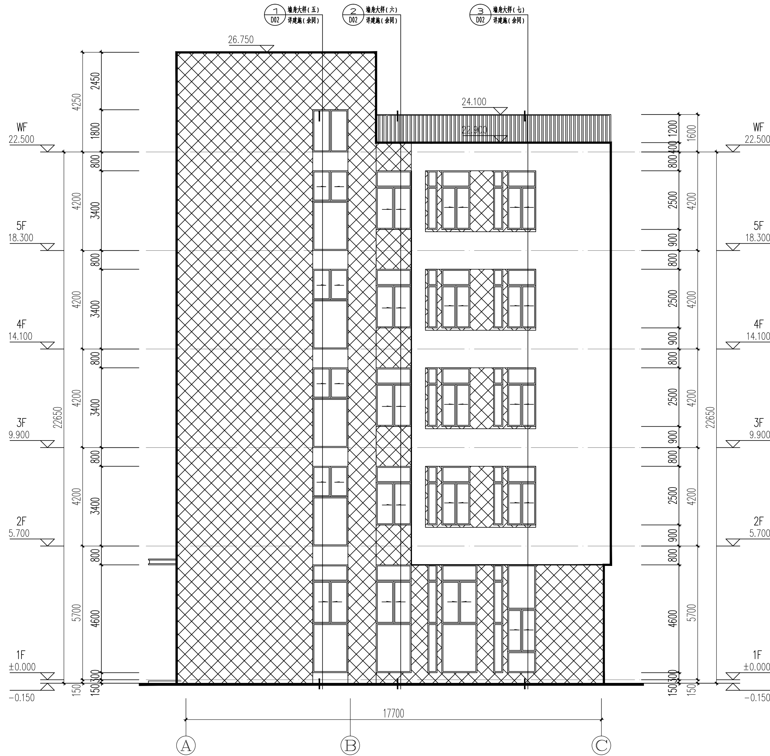
A~C轴立面图 1:100 变更前

电话总机: 0591-87513443 67512644 67566940 传真: 0591-67513775